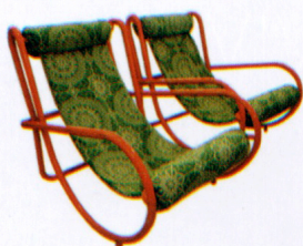
Fauteuil Locus Solus de Gae Aulenti (Poltronova).