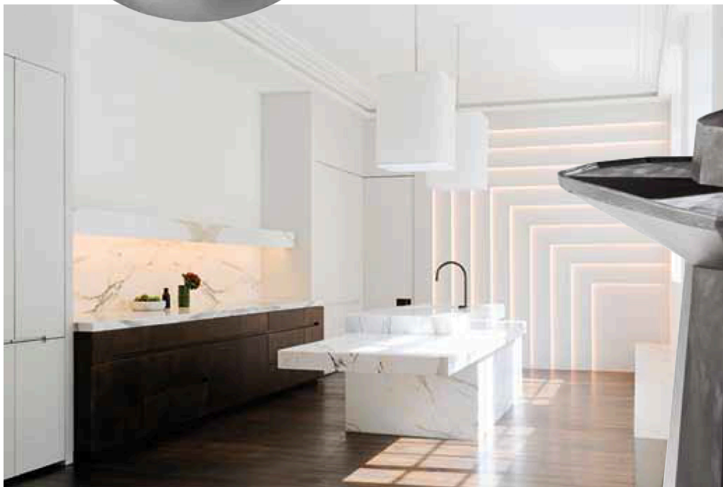
Cuisine « Signature » en strates de marbre Paonazetto, portes et tiroirs en bronze patiné, design Joseph Dirand, OBUMEX ( www.obumex.be ).

Un labo design où expérimenter de nouvelles recettes !