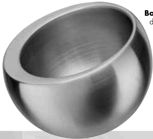
Bol « Balance » en inox, design Katja Höllermann, Ø 10 x h. 6,5 cm, 39,90 €, CARL MERTENS sur CULIN-ART.COM .