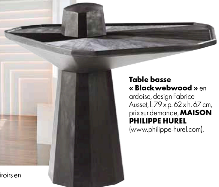
Table basse « Blackwebwood » en ardoise, design Fabrice Ausset, l. 79 x p. 62 x h. 67 cm, prix sur demande, MAISON PHILIPPE HUREL ( www.philippe-hurel.com ).