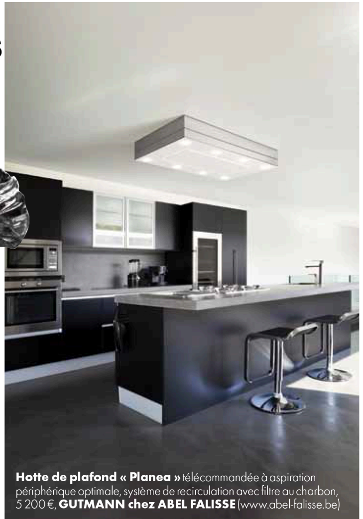
Hotte de plafond « Planea » télécommandée à aspiration périphérique optimale, système de recirculation avec filtre au charbon, 5 200 €, GUTMANN chez ABEL FALISSE ( www.abel-falisse.be )

Un labo design où expérimenter de nouvelles recettes !